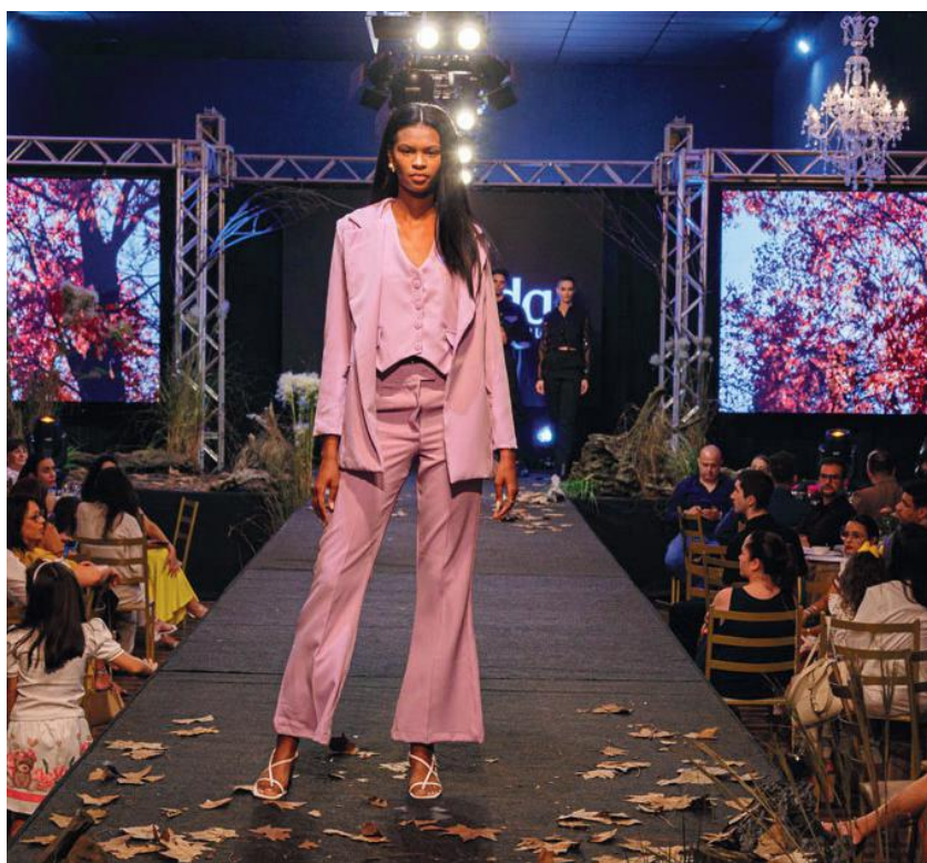
Com o tema Feel the Forest, o desfile teve como inspiração a transição da natureza entre o fim do outono e início do inverno