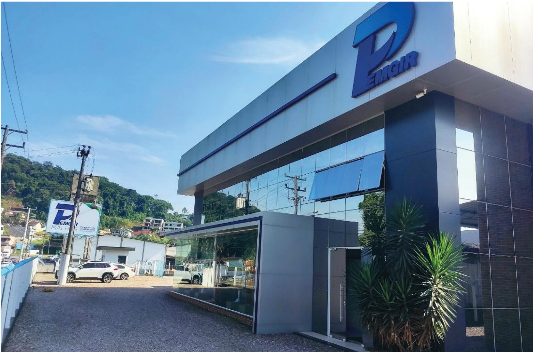
A empresa, localizada no bairro Bateas, conta com um parque fabril de mais de 7 mil metros quadrados