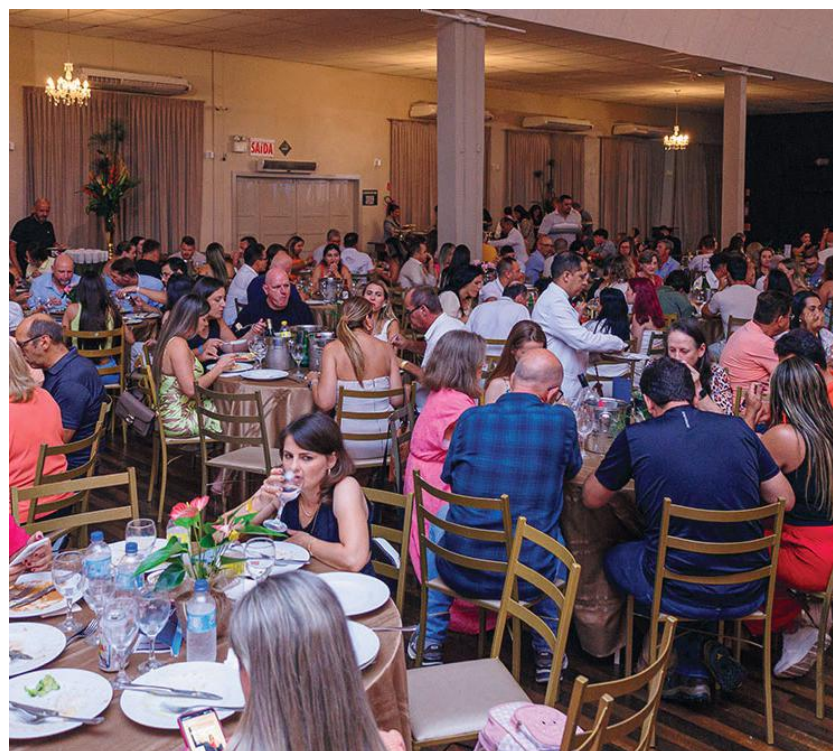
O evento foi prestigiado por mais de 500 pessoas, entre compradores, fabricantes, autoridades, imprensa e convidados